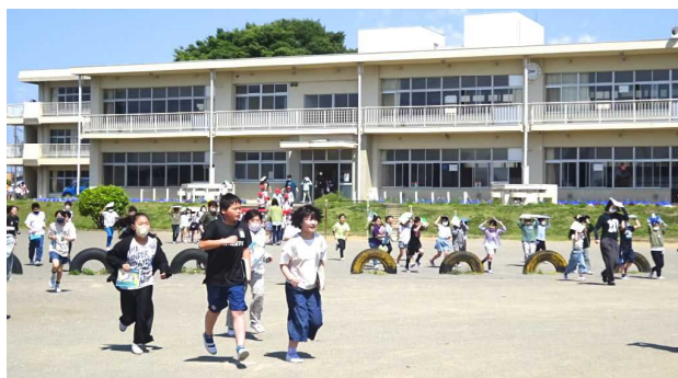
【校庭への避難の様子】