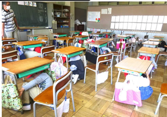
【まずは身を守る行動を（1年生の教室の様子）】

今回は、全員での初めての避難訓練でしたが、少しおしゃべりが聞こえてきたのが残念でした。命を守る大切な勉強であることを伝え、もしもの時にかげがえのない命を守るためにおしゃべりしないで指示が聞こえるとようにすることの大切さを児童の皆さんに話しました。地震はいつ来るか分かりません。ご家庭でも、もし大きな地震が起きたらどうするかを話し合ってみてください。