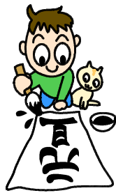
写真は5年生の書き初め大会の様子

新しい年がスタートし、各学年の児童が、真剣に書き初め大会に臨んでいます。3年生以上は書き初め用の長く大きな用紙に挑戦しています。どの子も力強い字をていねいに書いていました。ピンと張りつめた空気のなか、心を整えて、一生懸命に取り組む姿に、また成長を感じました。とても充実したひとときを過ごしていました。