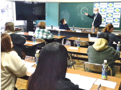
【学校保健委員会の様子】

12月1日に学校保健委員会を行いました。お忙しいなか、学校医さんや学校薬剤師さん、保健体育委員の皆様に参加していただきありがとうございました。