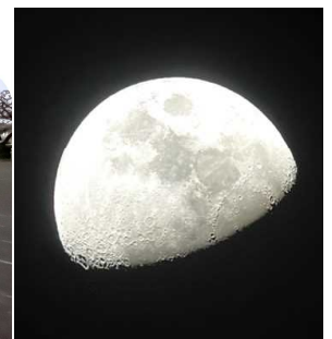
【天体望遠鏡で見た月】